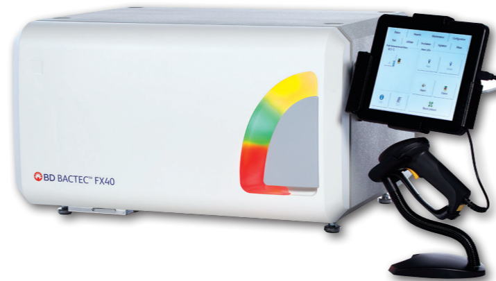
BD BACTEC FX40