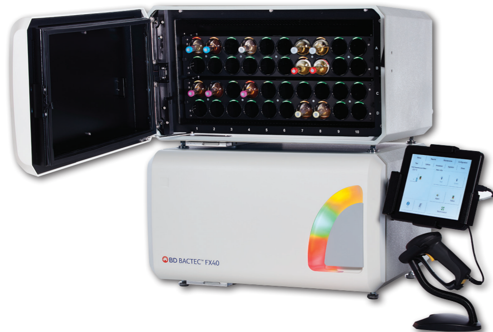
2 модуля BD BACTEC FX40