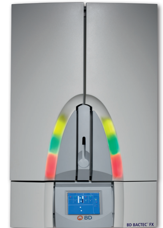
BACTEC FX Top