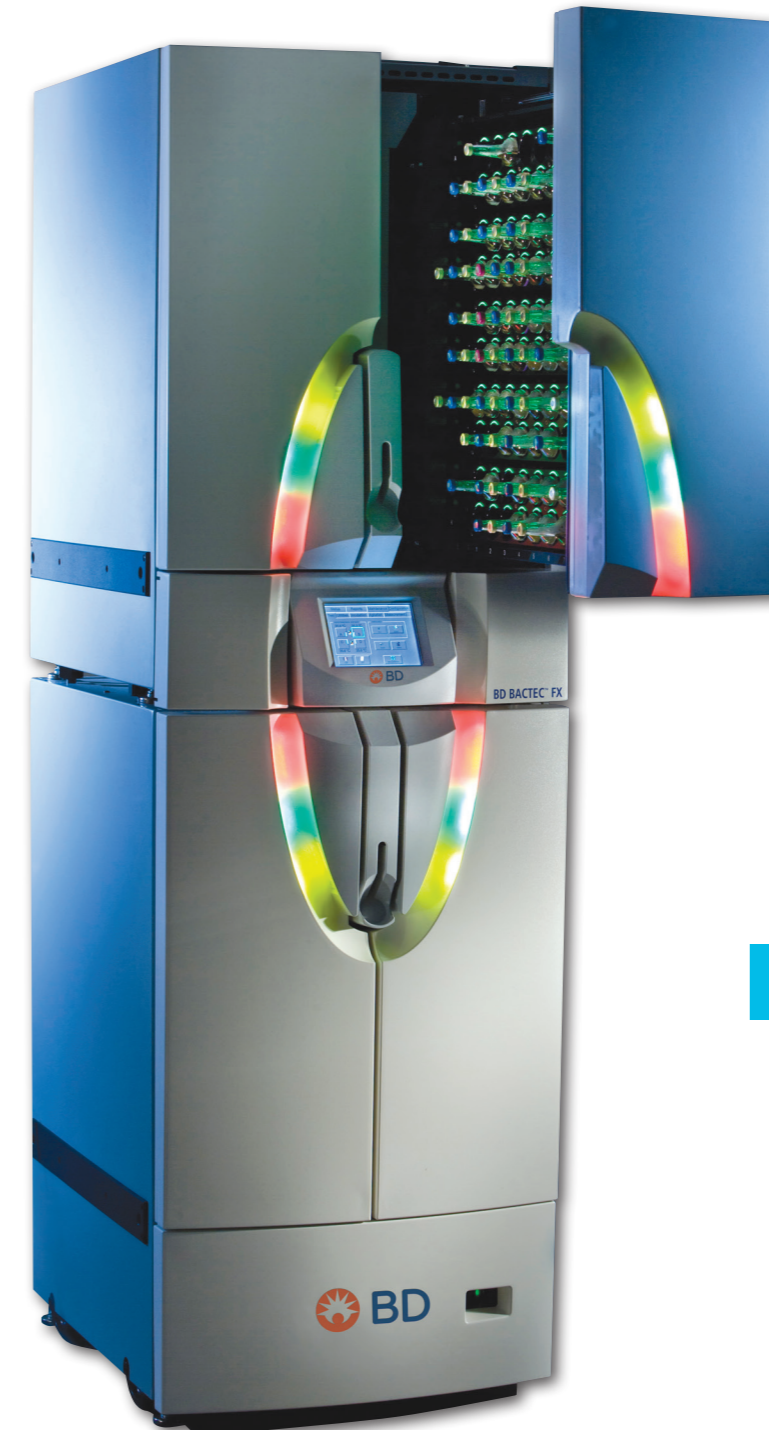
BACTEC FX Top и FX Bottom